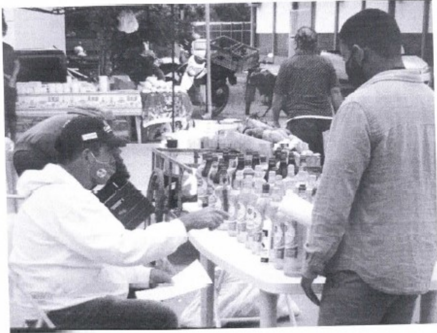
Ação educativa com os catadores de lixo recicláveis